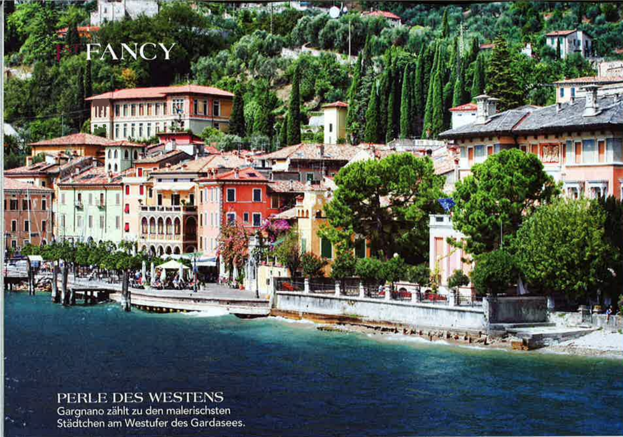
PERLE DES WESTENS Gargnano zählt zu den malerischsten Städtchen am Westufer des Gardasees.