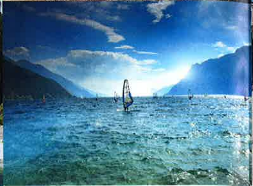
SURF & TURF Mountainbiker und Surfer kommen auch am Westufer des Gardasees auf ihre Kosten.